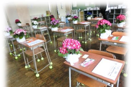
色鮮やかな花で入学生を歓迎