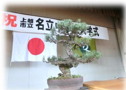
厳肅な雰囲気を引き立てる素敵な松