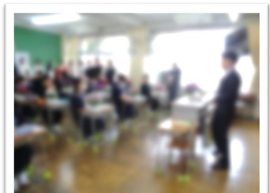
初めての学活 先生も生徒もやが緊張