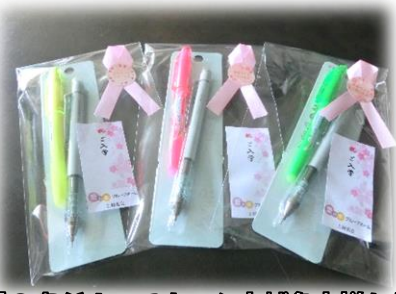
愛の家グループホーム上越名立様から 入学生一人一人に温かきプレゼント