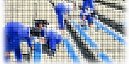
武将隊と〇×クイズ大会