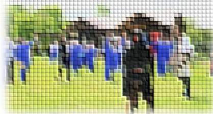
1~3年生のメンバーでお題を解く