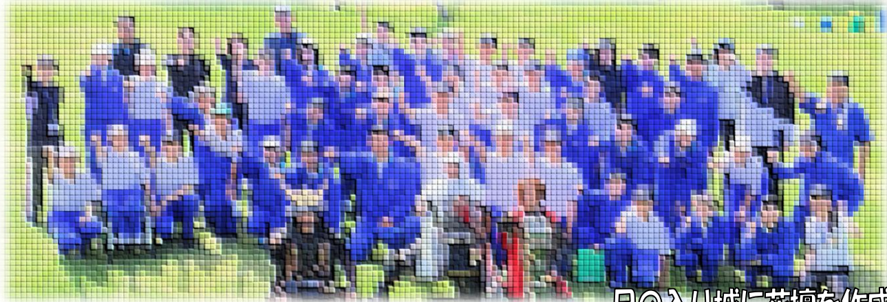
日の入り城に花壇を作成

5月16日（金）好天に恵まれた中、予定通り絆遠足を実施しました。絆遠足では、主に次の4つの活動を行いました。