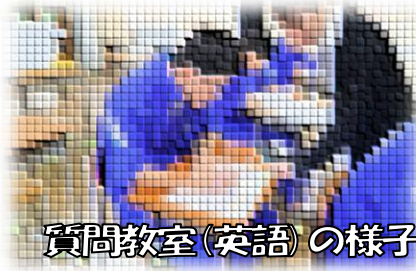
質問教室(英語)の様子