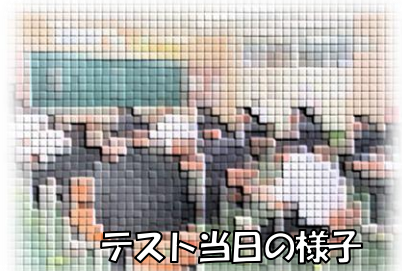
テスト当日の様子