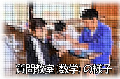
質問教室(数学)の様子

テスト当日は、各学年の教室に入ると朝から多くの生徒が教科書やワークを開き、一生懸命に学習に取り組む姿が見られました。試験が始まると、生徒たちは真剣な表情で問題用紙に目を通し、これまでの学習の成果を発揮しようと懸命に取り組んでいました。