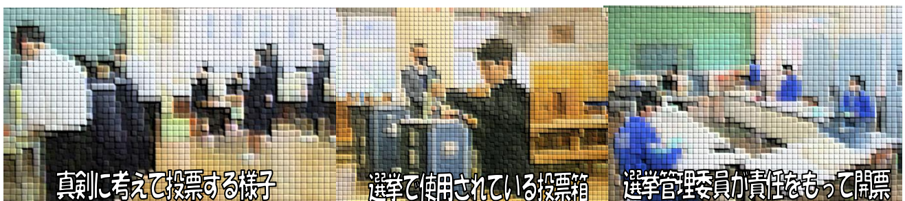
真剣に考えて投票する様子

翌9日(火)に投票・開票は選挙管理委員による厳正な運営のもとで行われ、公平さが保たれました。選挙期間を通じて、立候補者や責任者は計画性やリーダーシップを磨き、ルールの中で正々堂々と競い合い大きな成長を遂げました。また、陰で支えた選挙管理委員の努力と献身により、選挙が円滑に進められました。今回の選挙を通して、民主的な仕組みの大切さを学ぶとともに、私たち一人ひとりが学校をより良くしていく主体であることを改めて感じる事ができました。