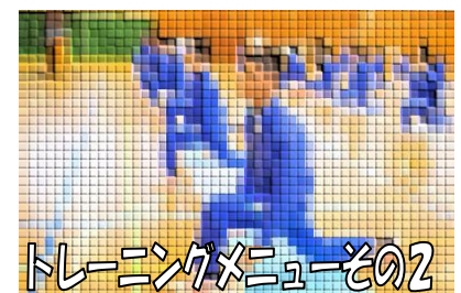
トレーニングメニューその2