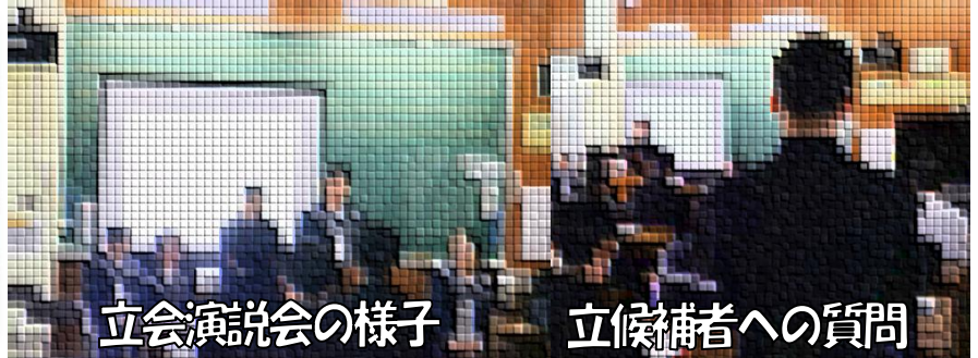
立会演説会の様子