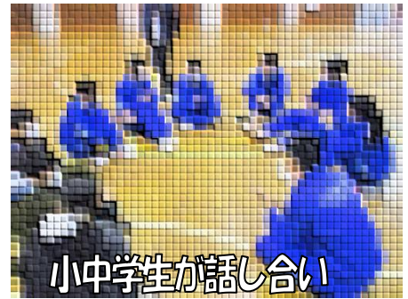
小中学生が話し合い

会のはじめに名立中1年生と宝田小児童が準備したアイスブレイクを行いました。グループごとの協力が鍵となるアトラクションで、アイスブレイクが始まると自然と笑顔が見られました。次に、「SNS上での適切なコミュニケーション」をテーマに、グループごとに意見交換を行いました。生徒会総務の生徒がスライドを活用して、見方や考え方が人それぞれであることをいわゆる「だまし絵」を用いて説明しました。見方や考え方が異なる他者が、顔の見えない空間でコミュニケーションをとるSNSの危険性について改めて、参加者全員で考えました。しめくくりとして「いじめ防止・見逃しゼロ宣言」を会場の全員で宣誓し、代表の児童・生徒が感想を発表しました。