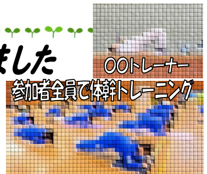
〇〇トレーナー 参加者全員で体幹トレーニング

〇〇様は、元ビーチバレープロ選手でもあったこともあり、フィットネスの意義や楽しくすきま時間で手軽にできる筋力アップトレーニングについて実践を交えて教えてくれました。保護者の皆様にも多数ご参加いただき、大変ありがとうございました。ある生徒は、「ストレッチや軽い運動をして心もスッキリとしたので受験勉強の合間とかにも取り入れていきたい。」と感想を述べていました。