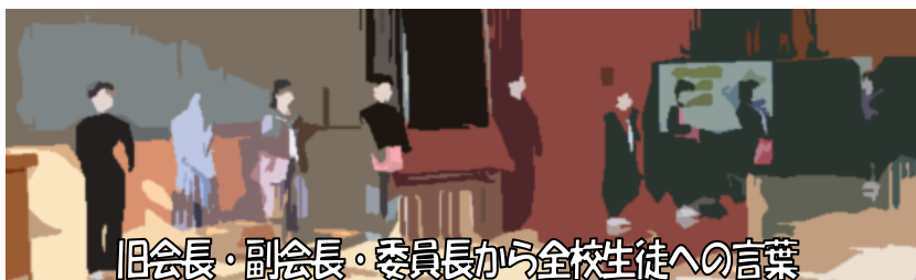
旧会長・副会長・委員長から全校生徒への言葉

生徒総会後には、各委員長の引継ぎ式が行われました。3年生の委員長が感謝の気持ちなどを、新生徒会長と新委員長は来年度に向けた決意を述べました。これからは1・2年生が中心となり、生徒会活動を引き継いでいくことになります。