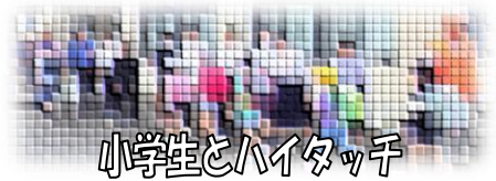
小学生とハイタッチ

1年生が6月4日(木)・5日(金)の2日間、コミュニティプラザ前で「小中合同あいさつ運動」を行いました。この活動は、小中学生に挨拶の大切さを感じてもらおうとともに、挨拶で地域を元気にしたい、という目的で行われるものです。今年も、「名立の子どもを守り育む会」や地域の皆様からもご参加いただきました。1年生は、スクールバス乗車前の小学生とハイタッチしながら「おはよう」と元気よく挨拶を交わしました。最後に、大人と中学生とでハイタッチをして全員が気持ちよく活動を終わることができました。小中学生だけでなく、一緒に参加した大人の皆さんの表情がとても明るく印象的な活動となりました。