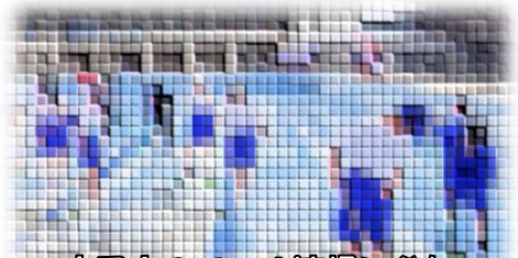
宝田小のプール清掃に参加

昨年度より宝田小学校のプールをお借りして水泳授業を実施しています。そこで、今年度も5月28日(木)に1年生が宝田小を訪れ、小学生と一緒にプール清掃を行いました。皆で協力して丁寧に磨いたことで、泥だらけだったプールは見違えるほどきれいになりました。水泳の授業は、6月から7月にかけて合計3回予定されています。