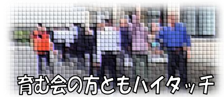
育む会の方ともハイタッチ